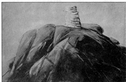
• Hjärterö kummel.