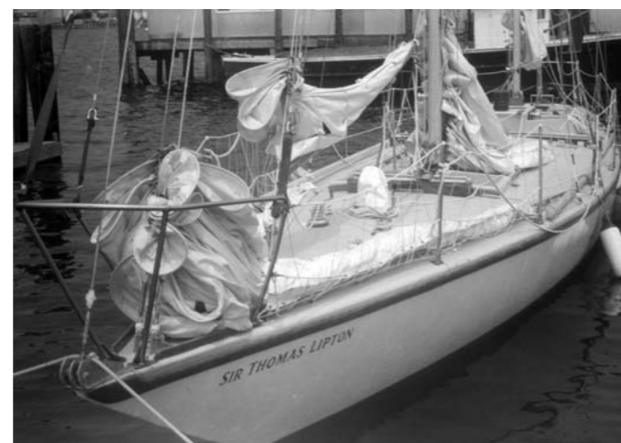
”Sir Thomas Lipton”