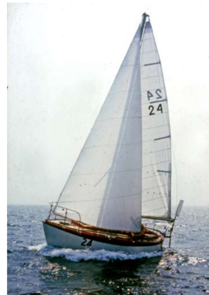
Fiones maxgenua satt utanför Englands kust.